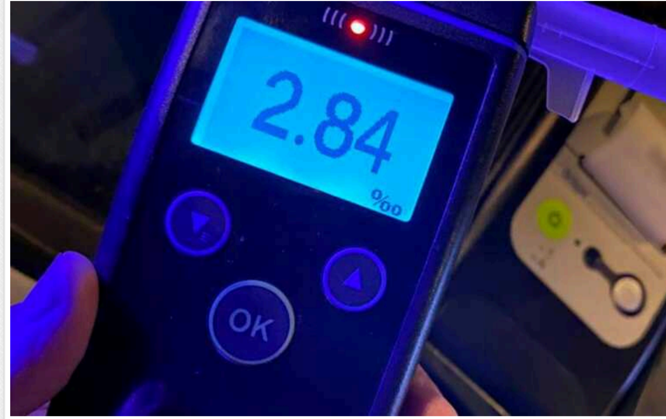
Київські поліцейські минулого року склали понад 8 000 протоколів за керування у стані сп'яніння

За 2023 рік у Києві поліцейськими зафіксовано понад 8 тис. випадків керування транспортними засобами з ознаками алкогольного або наркотичного сп'яніння. Загалом на території країни оформлено понад 151 тис. випадків керування у нетверезому стані.