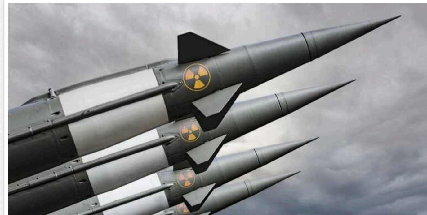
Сполучені Штати досі побоюються, що РФ може застосувати ядерну зброю, — The Sunday Times

Саме це – одна із причин, чому США постійно відмовляються надати Україні зброю далекого радіусу дії.