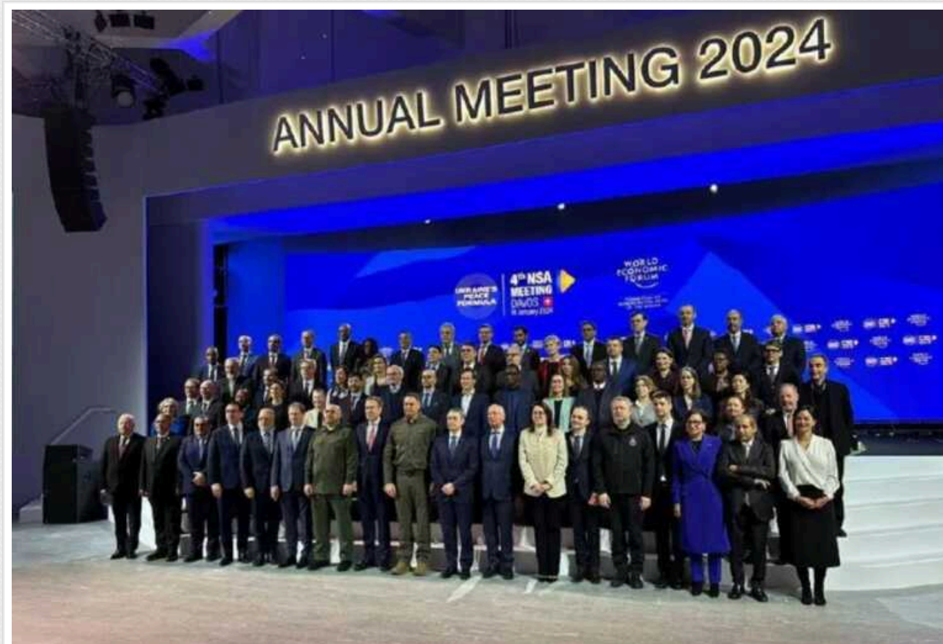
У Давосі представники 80 країн світу обговорили Формулу миру для України

Учасники Світового економічного форуму в Давосі (Швейцарія) обговорили Формулу миру для України. Представники понад 80 країн говорили про світовий порядок та справедливість.