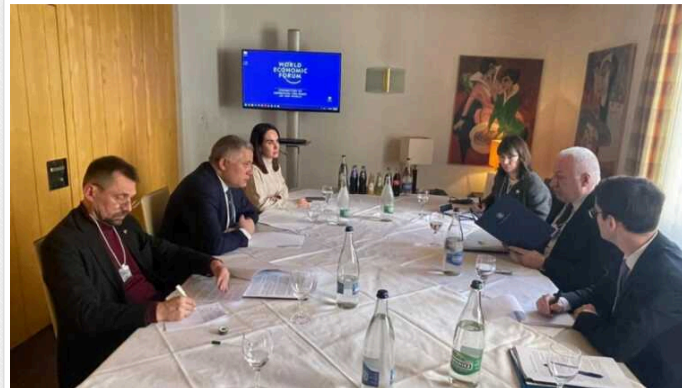
Україна розпочала переговори з Румунією щодо угоди про безпеку

Українська сторона розпочала двосторонні переговори з Румунією про укладення двосторонньої безпекової угоди. Це відбулось на полях четвертої зустрічі радників із питань національної безпеки щодо Формули миру в Давосі.