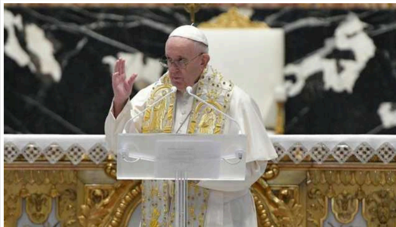
Папа Римський під час недільної молитви закликав не забувати про Україну

Під час недільної зустрічі з паломниками Папа Римський Франциск знову закликав не забувати про страждання різних народів від війни, згадавши зокрема про Україну.