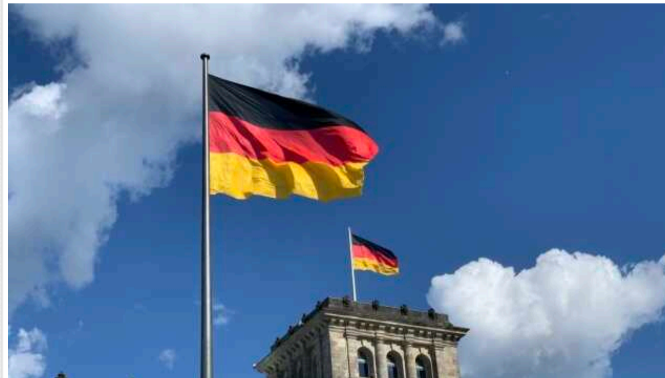
У Німеччині сподіваються на збереження статусу-кво Тайваню

Німеччина привітала проведення виборів на Тайвані та водночас підкреслила готовність розширювати відносини на принципах існування одного Китаю.