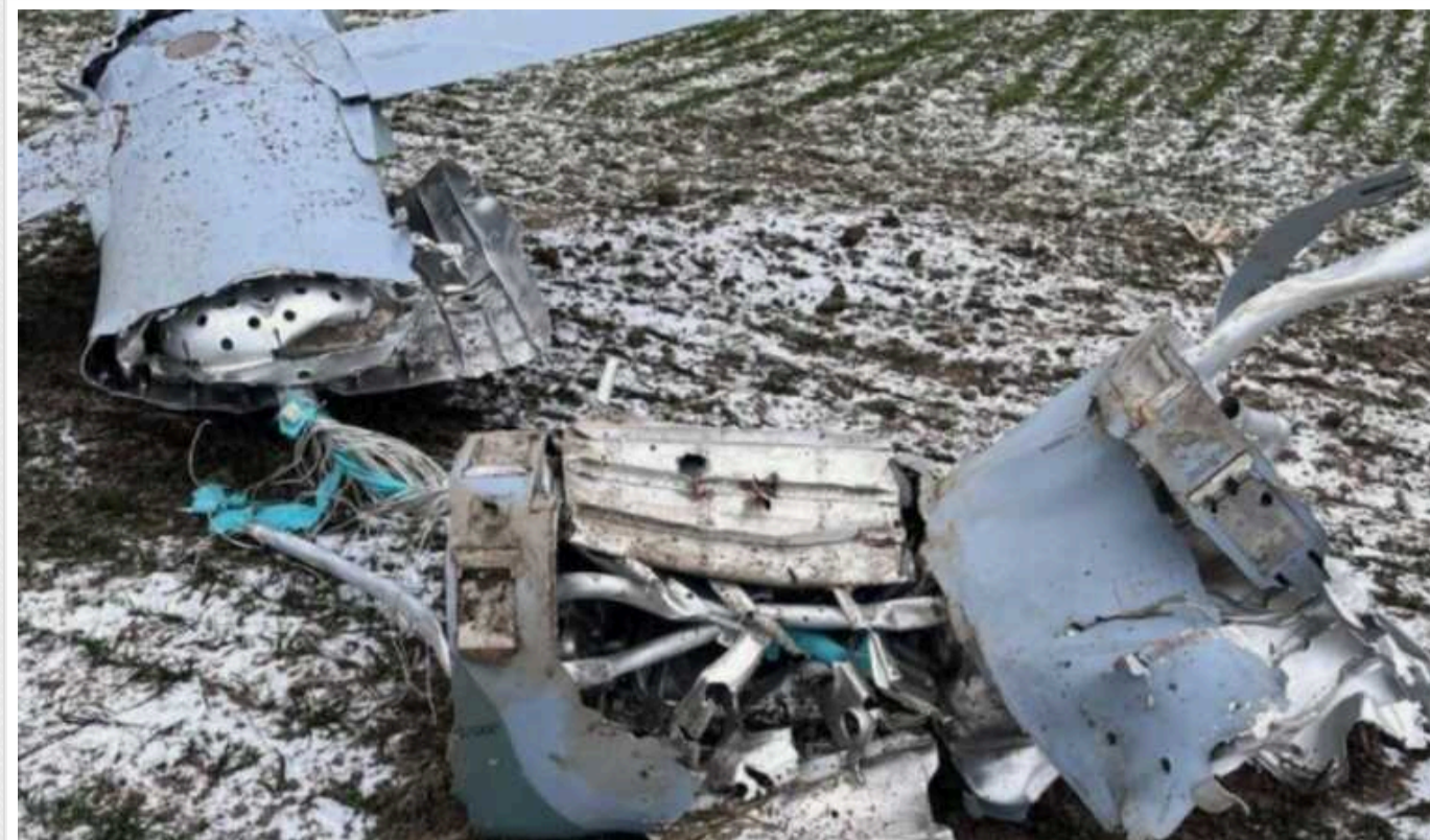
Українські РЕБ зуміли знешкодити понад 20 ворожих ракет, — ISW

Аналітики зазначили, що українські захисники адаптуються до нових комплексних повітряних ударів противника і здатні розпізнавати їхні закономірності.