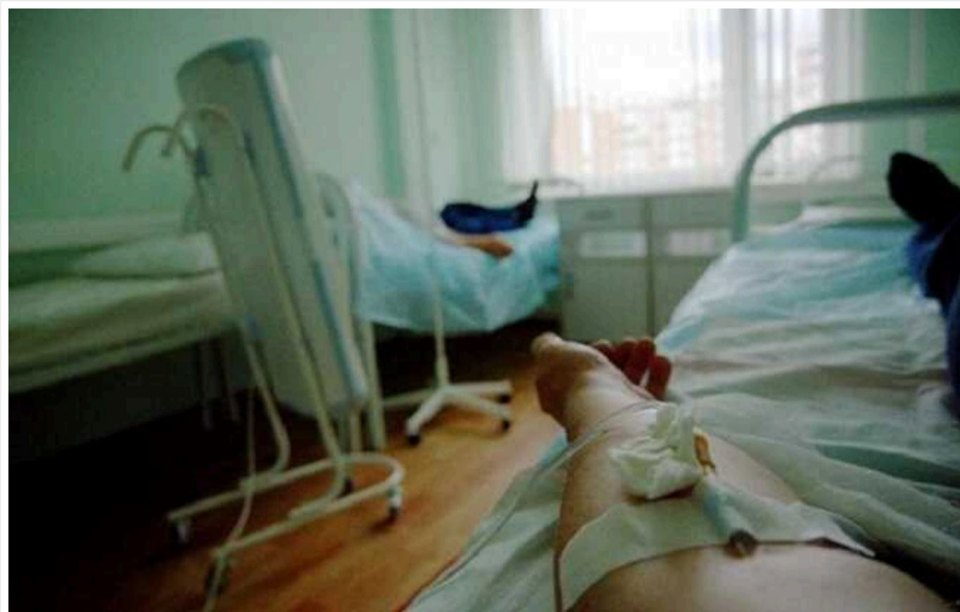
Британська розвідка: Російська медицина страждає через вторгнення РФ в Україну

Через вторгнення Росії в Україну страждає російська медицина. Вплив війни на охорону здоров'я відчуває на собі громадянське населення РФ.