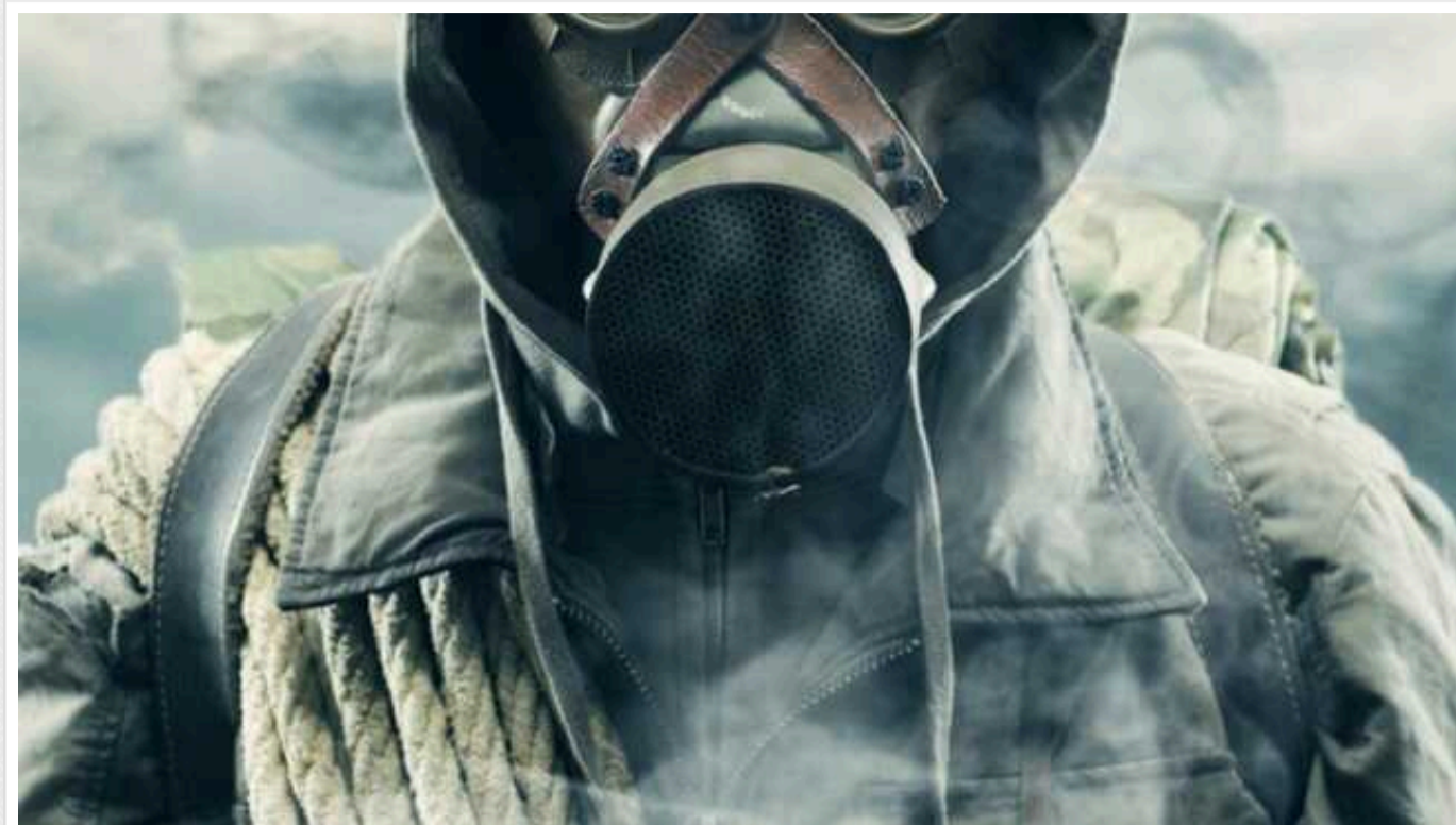
ЗСУ: Від початку повномасштабної війни РФ проти України 626 разів застосувала хімічні боєприпаси

Про це служба зв'язків з громадськістю Командування Сил підтримки Збройних сил України повідомляє у Фейсбуці.