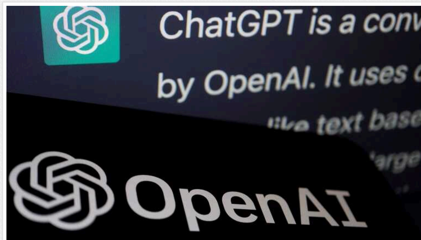
ChatGPT дозволили використовувати у військових цілях

Компанія OpenAI змінила правила використання своїх технологій, зокрема ChatGPT. З політики використання видалили заборону застосування сервісів у військових цілях.