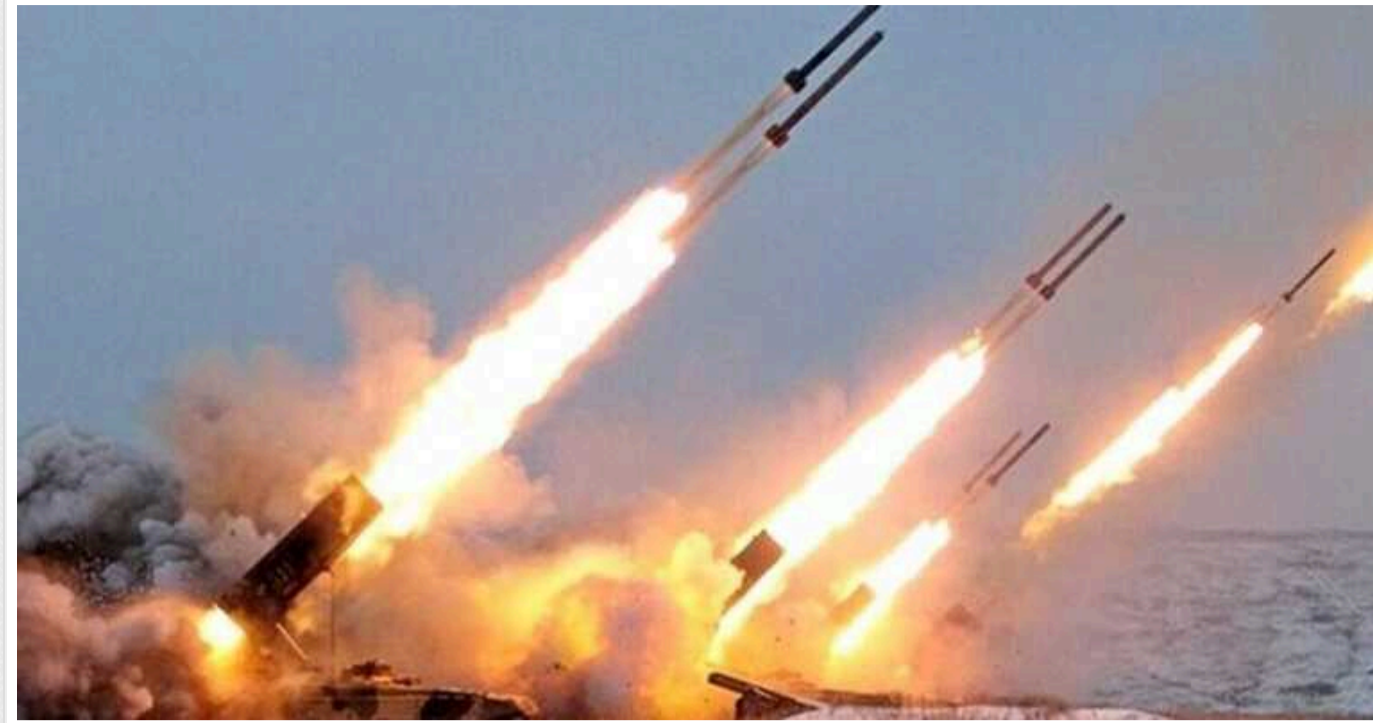
В ISW вказали на важливий нюанс з ракетною атакою РФ по Україні: "Може бути переломом"

Під час комбінованої повітряної атаки країни агресора Росії на Україну зранку 13 січня понад два десятки російських ракет та дронів не досягли цілей через самопідриц, влучання у безлюдні місця та успішну протидію засобів радіоелектронної боротьби. Виведення із ладу такої кількості ракет за допомогою засобів РЕБ може бути переломним моментом у можливостях української армії.