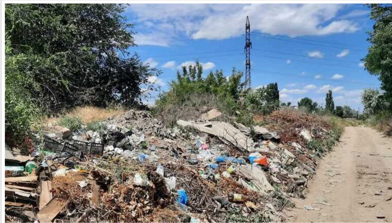
РФ хоче створити на окупованій Донеччині і Луганщині звалища для російського сміття

Країна-агресор Росія продовжує знищати з жителів тимчасово окупованих нею територій України. Загарбники збираються збудувати на захоплених Донеччині та Луганщині низку сміттєзвалищ.