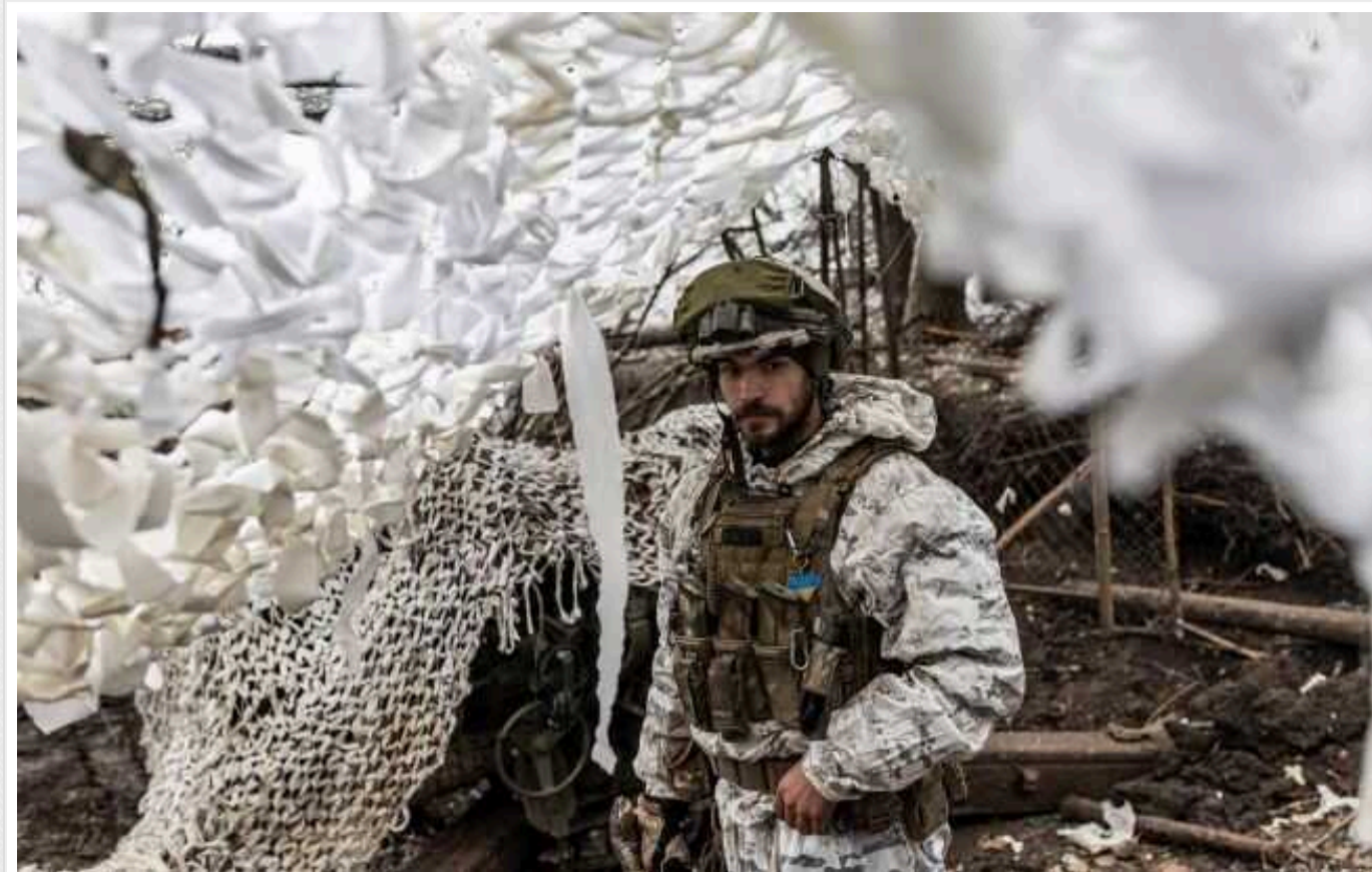
ISW: РФ готує десантні бригади, які хоче закинути в тил українських Сил оборони

Війська Росії можуть формувати десантно-штурмові бригади у складі загальновійськових сухопутних з'єднань у межах щирокомасштабних військових реформ. Передбачається, що вони діятимуть як спеціалізовані підрозділи, здатні проводити десантування та розвідку в тилу Сил оборони України.