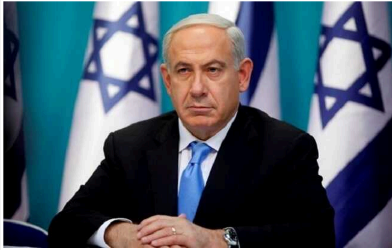
На сотий день війни Нетаньягу назвав умову, без якої операцію у Газі не закінчать

Прем'єр-міністр Ізраїлю Бенямін Нетаньягу заявив, що країна продовжуватиме війну проти ХАМАС "до кінця – до повної перемоги". Він засудив претензії Південної Африки, подані цього тижня до Міжнародного кримінального суду в Гаазі, що Тель-Авів здійснює геноцид проти палестинців у секторі Газі.