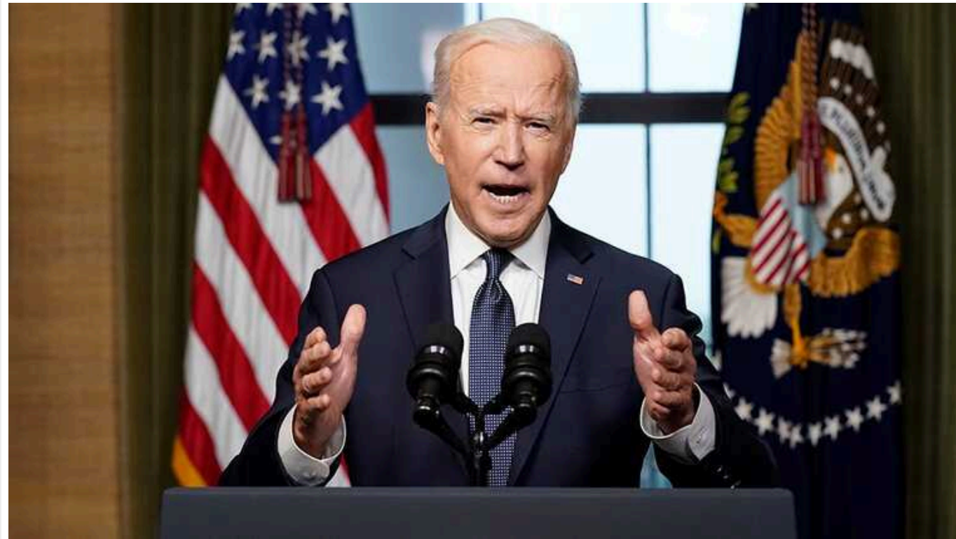
Байден: США не підтримують незалежність Тайваню

Сполучені Штати не підтримують незалежність Тайваню після того, як тайванські виборці дали відсіч Китаю і надали правлячій партії третій президентський термін.