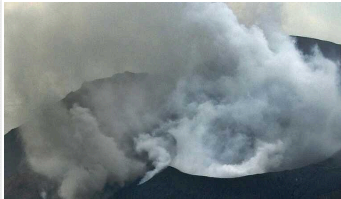
У Японії почалося виверження вулкана Отаке: рівень небезпеки підвищено до трьох

Сьогодні, 13 січня, на південно-західному японському острові Суваносе почав вивергатися вулкан Отаке.