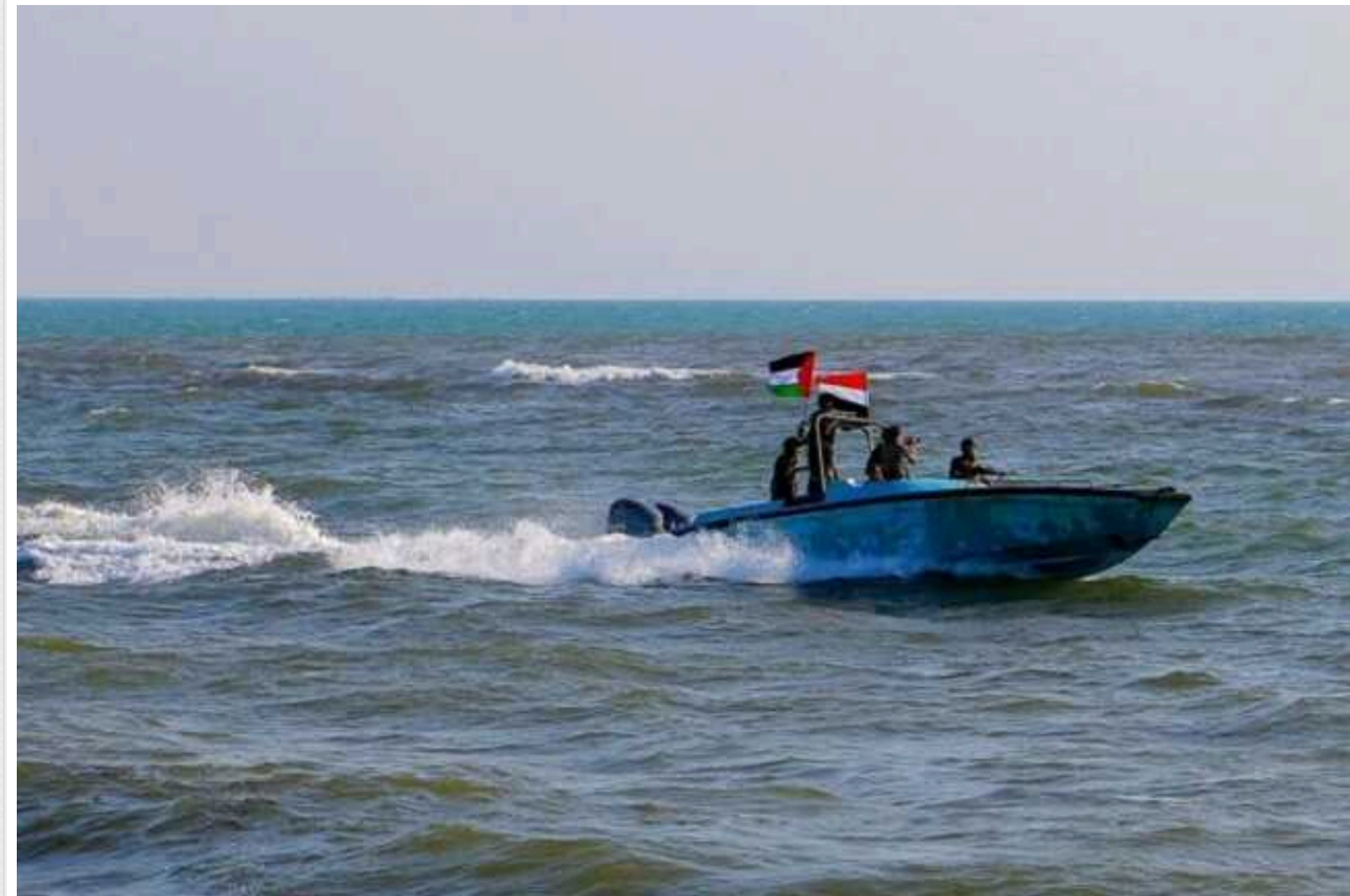
NYT: Після двох хвиль ударів хусити досі мають сили атакувати кораблі

Внаслідок авіаударів, завданих Сполученими Штатами та Британією за об'єктами в Ємені, контрольованими хуситами, було пошкоджено або знищено близько 90% цілей. При цьому бойовики зберегли близько трьох чвертей своїх можливостей щодо обстрілу ракетами та безпілотниками суден у Червоному морі.