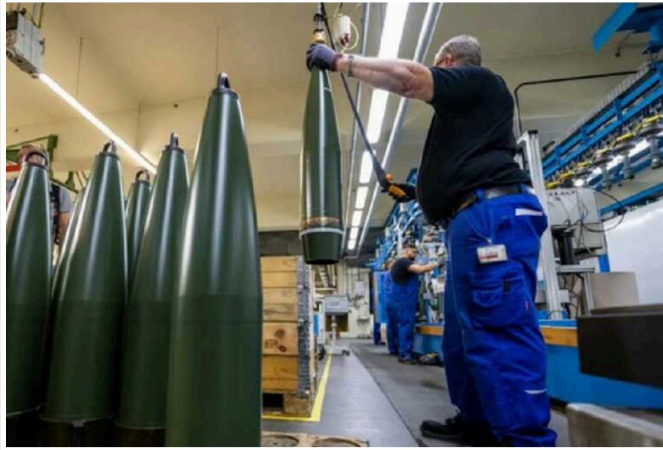
Швеція збільшить виробництво 155-мм боєприпасів для України: підписали угоду з Nammo

Швеція підписала угоду з виробником боєприпасів Nammo щодо збільшення виробничих потужностей артилерійських боєприпасів у країні.