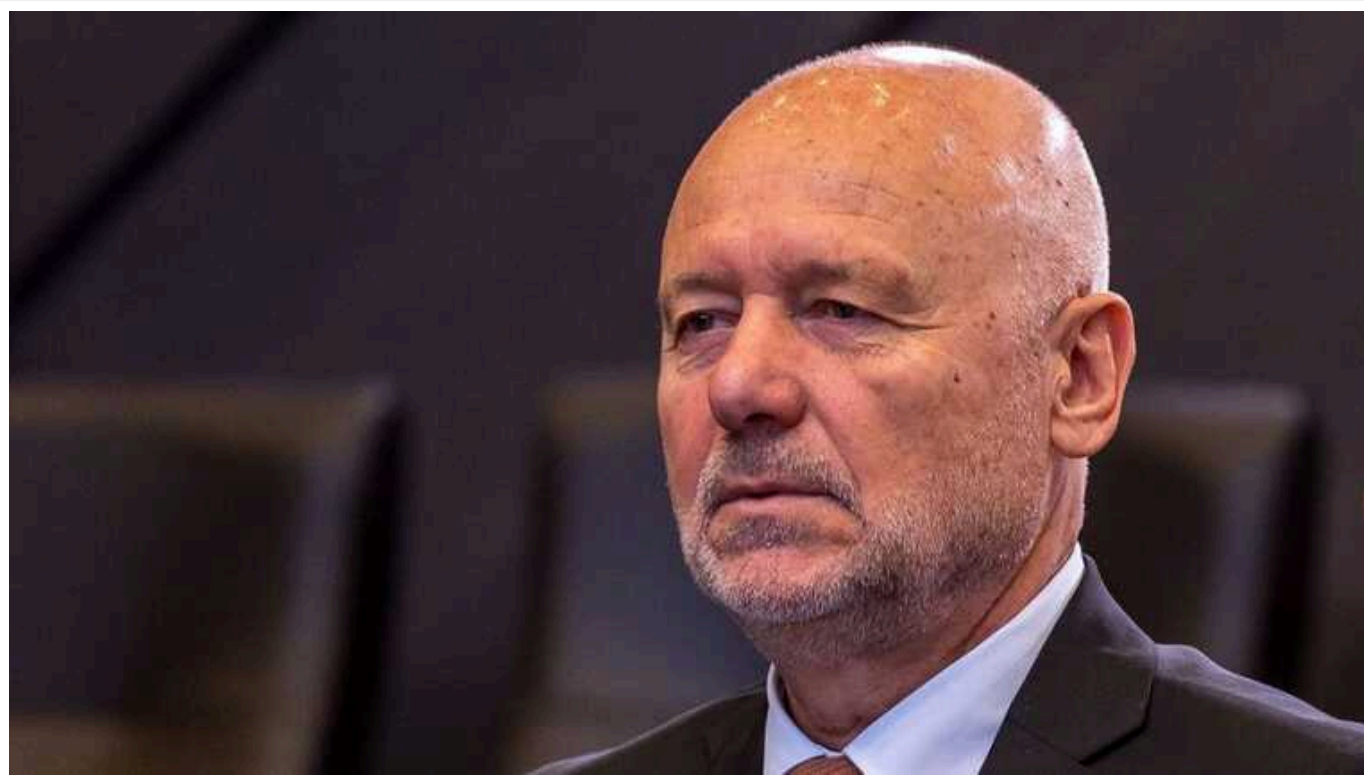
Глава Міноборони Болгарії Тагарев: Україна може перемогти і відновити територіальну цілісність за умови постійної підтримки з боку демократичних країн

Міністр оборони Болгарії Тодор Тагарев вважає, що Україна може перемогти у війні проти Росії.