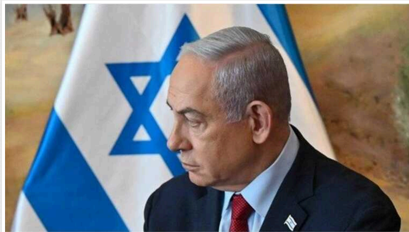
Нетаньягу заявив, що Ізраїль на шляху до перемоги у війні з ХАМАСом

Ніхто не зупинить Ізраїль у війні проти терористичної організації ХАМАС.