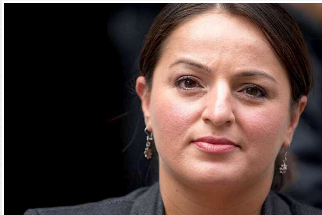
Мінекономіки Німеччини офіційно заявило, що не проводили перевірку використання німецької зброї в Україні

Німеччина не перевіряла, як німецька зброя використовується в Україні.