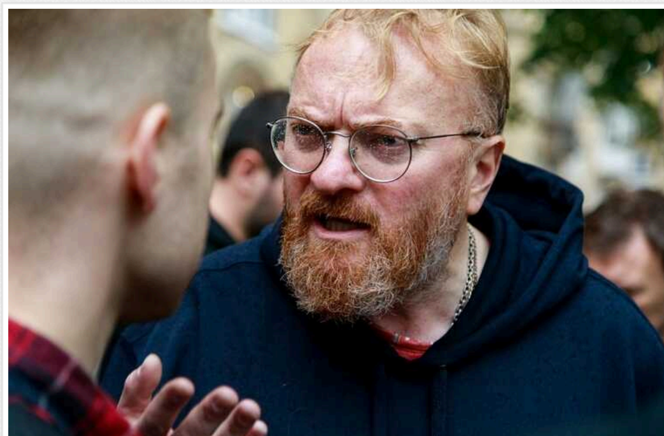
Втеча російських чемпіонів до США викликала істеріку в Держдумі: "По суті вони виявилися богузами, зрадниками та перебіжчиками"