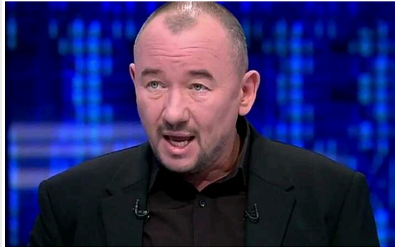
Російський пропагандист зізнався, навіщо їм "росіяни" з сусідніх держав: лише для сюжетів

Російський пропагандист Артем Шейнін зізнався, навіщо Кремлю "росіяни" з сусідніх держав. Він заявив, що вони треба лише для проросійських сюжетів.