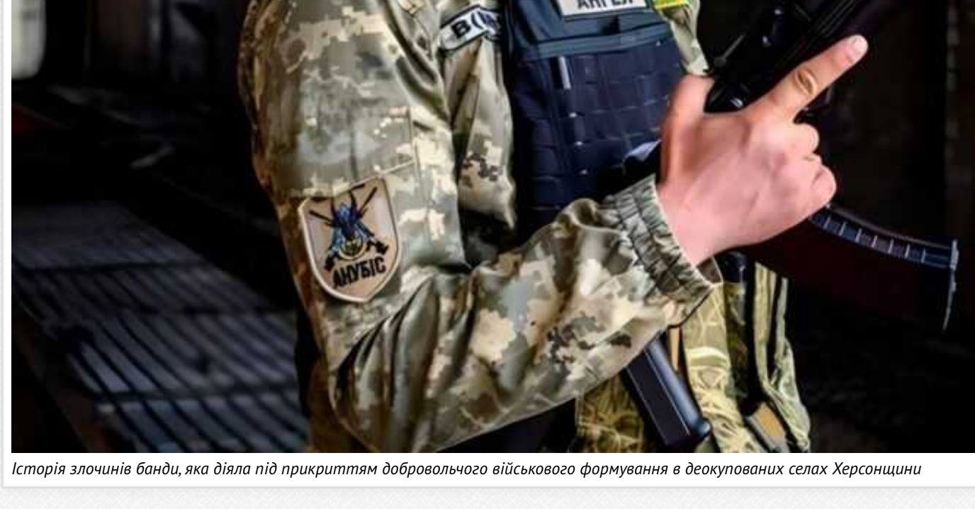
Історія злочинів банди, яка діяла під прикриттям добровольчого військового формування в деокупованих селах Херсонщини