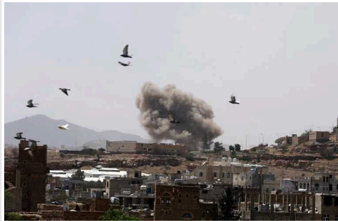
Нова "гаряча точка": чи спровокує "втихомирнення" хуситів регіональну війну

США та Велика Британія в ніч на 12 січня завдали ударів по тренувальних центрах та сховищах дронів хуситів у Ємені. Це сталося після того, як останні атакували кораблі у Червоному морі. Але я поки що не бачу причин говорити про розширення війни, тобто виходу її за межі тих обмежених ракетних ударів, які ми побачили.