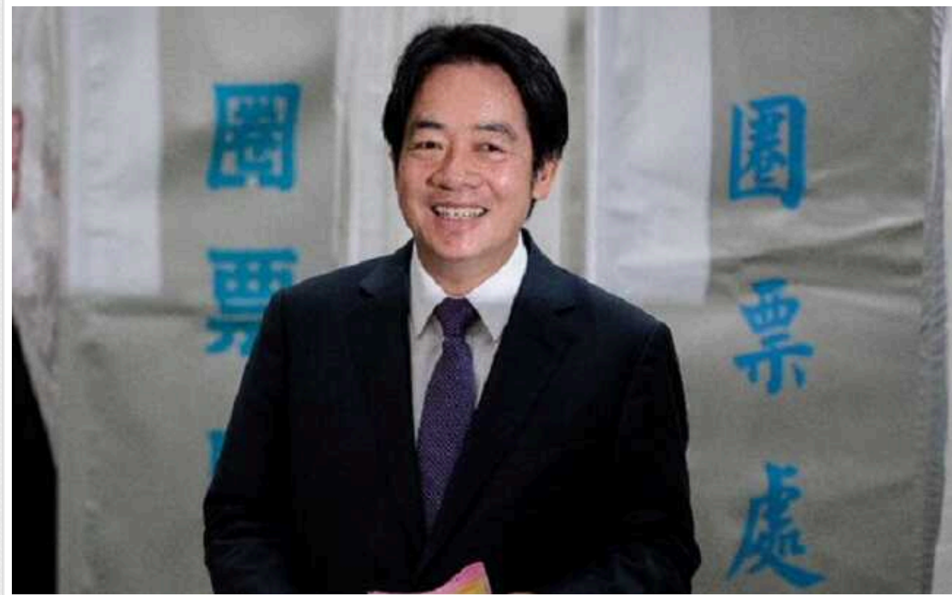
У Тайвані на президентських виборах переміг найгірший для Китаю кандидат

Перемогу на виборах президента Тайваню, які відбулися в суботу, 13 січня, отримав кандидат від правлячої партії Лай Цінде з результатом 40,2% голосів. Він виступає за окрему ідентичність Тайваню та відкидає територіальні претензії Китаю.