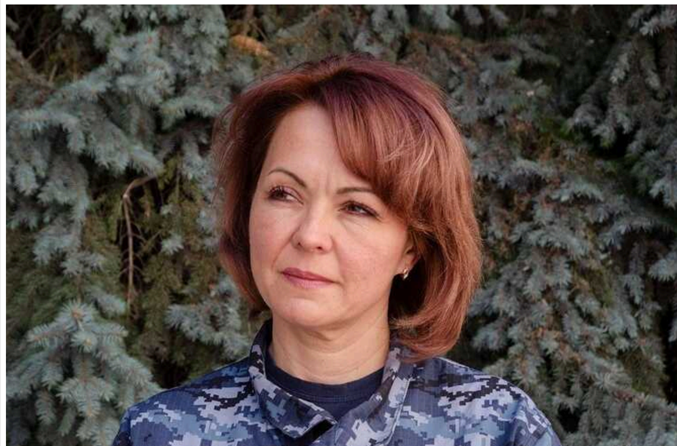
Окупанти почали нові штурми на півдні України: намагаються прорвати оборону, – Гуменюк

Росія знову розпочала активні штурми на півдні України, але тепер використовує для наступу не тільки підрозділи "Шторм-Z", а й морську піхоту з десантом.