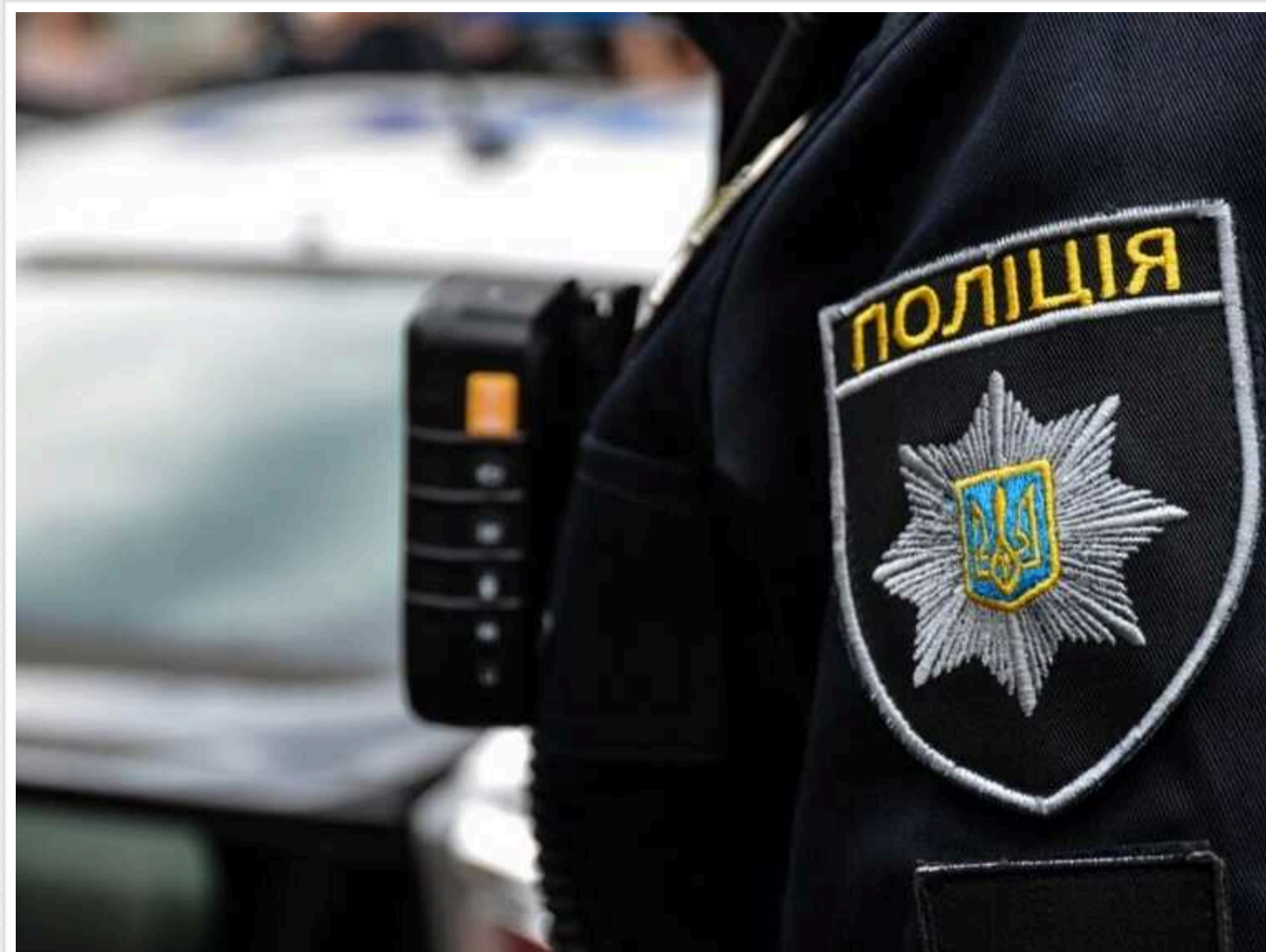
На Сумщині співробітники поліції викрали чоловіка, били його, щоб той підписав визнання в крадіжці телефону, — ЗМІ

Про це пишуть ЗМІ з посиланнями на джерела у правоохоронних органах.