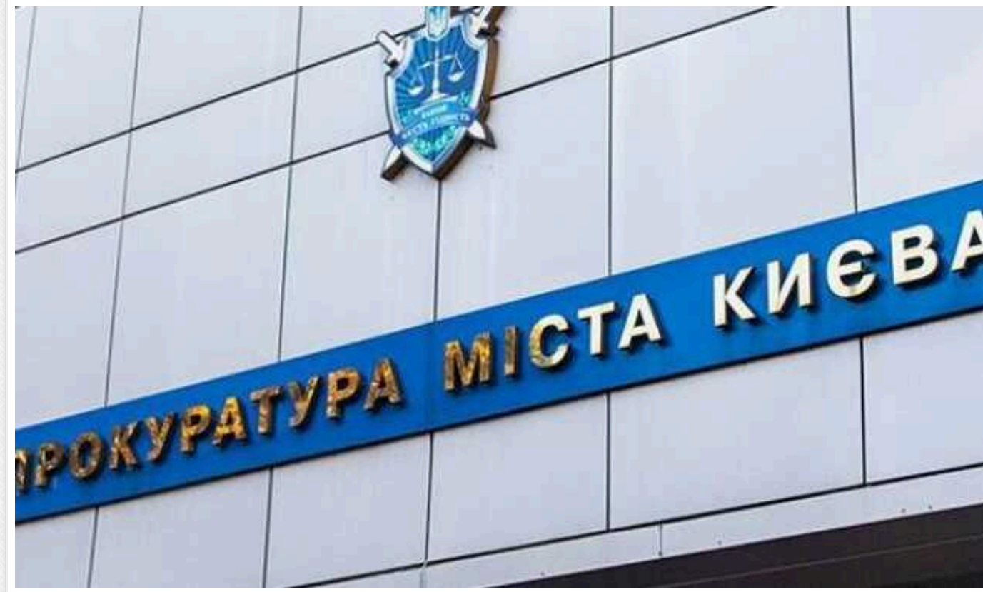
У Києві жінка вимагала 9,5 тис. євро з благодійної організації за внесення до бази "Шлях"

У Києві викрили жінку, яка вимагала гроші з представників благодійної організації за внесення до бази "Шлях". Свої "послуги" зловмисниця оцінила в 9,5 тис. євро.