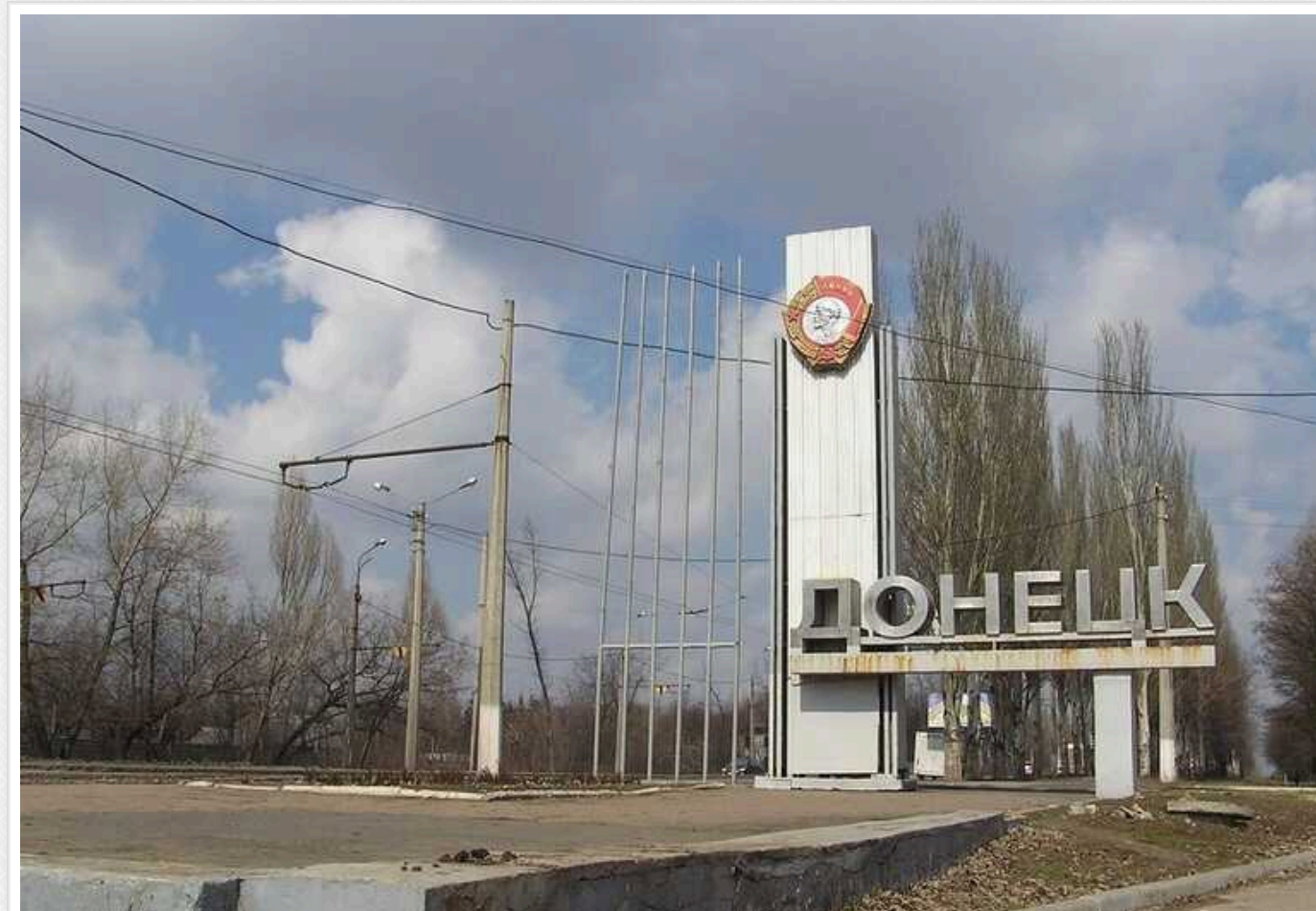
В окупованому Донецьку "стихийний бунт": «Коли ми будемо нормально жити?»

«Коли ми будемо нормально жити?», – запитують жителі окупованого Донецька у колаборантів та окупантів, які захопили місто у 2014 році.