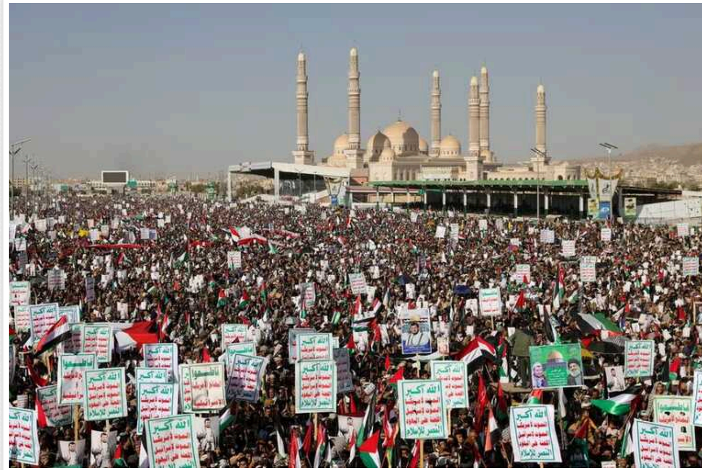
Reuters: У Ємені спалахнули масові протести після атак США та Великої Британії

У п'ятницю, 12 січня, після ударів США і Британії по об'єктах, пов'язаних із хуситами, у Ємені спалахнули протести. Десятки тисяч жителів країни вийшли на вулиці в кількох містах, аби почути заяви своїх лідерів із засудженням цих атак.