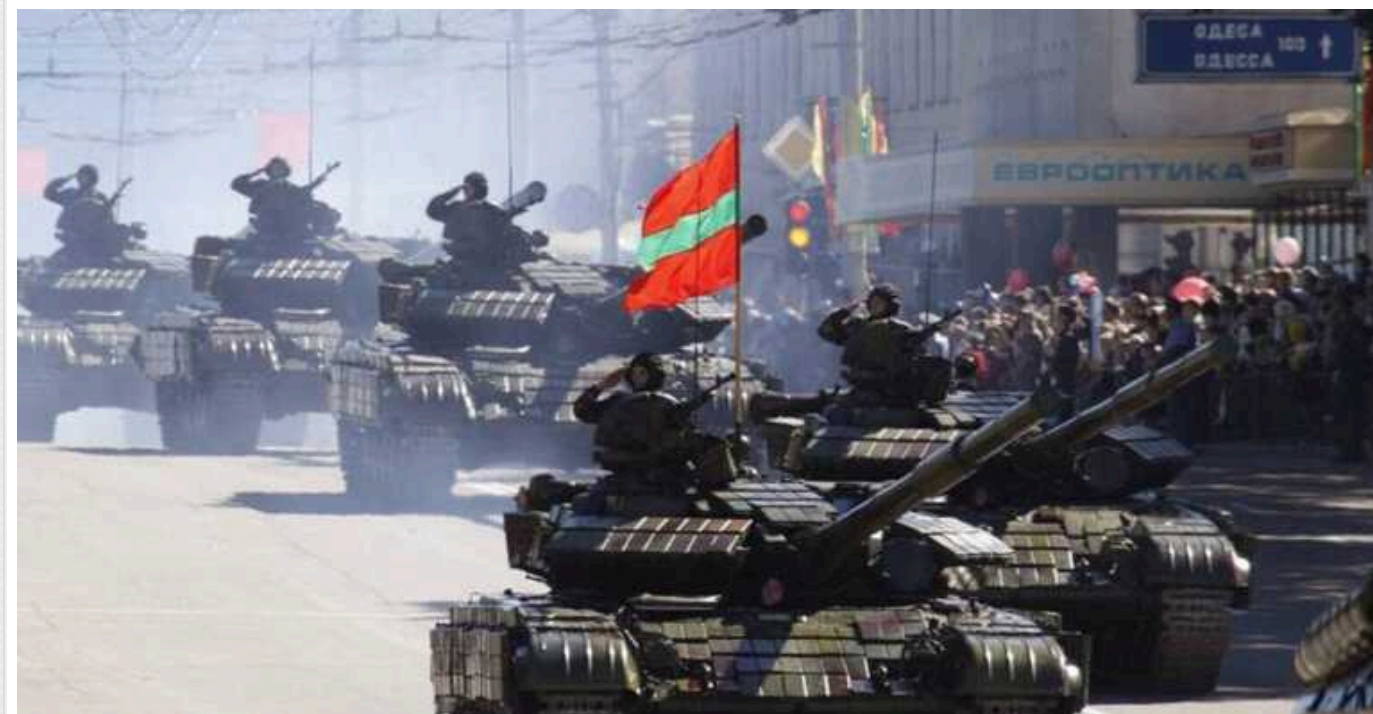
РФ може готувати у Придністров'ї операцію під "чужим прапором", – ISW

За словами аналітиків, у Придністров'ї повідомили, що Молдова нібито готує бойові групи для руйнування критично важливих об'єктів і диверсій.