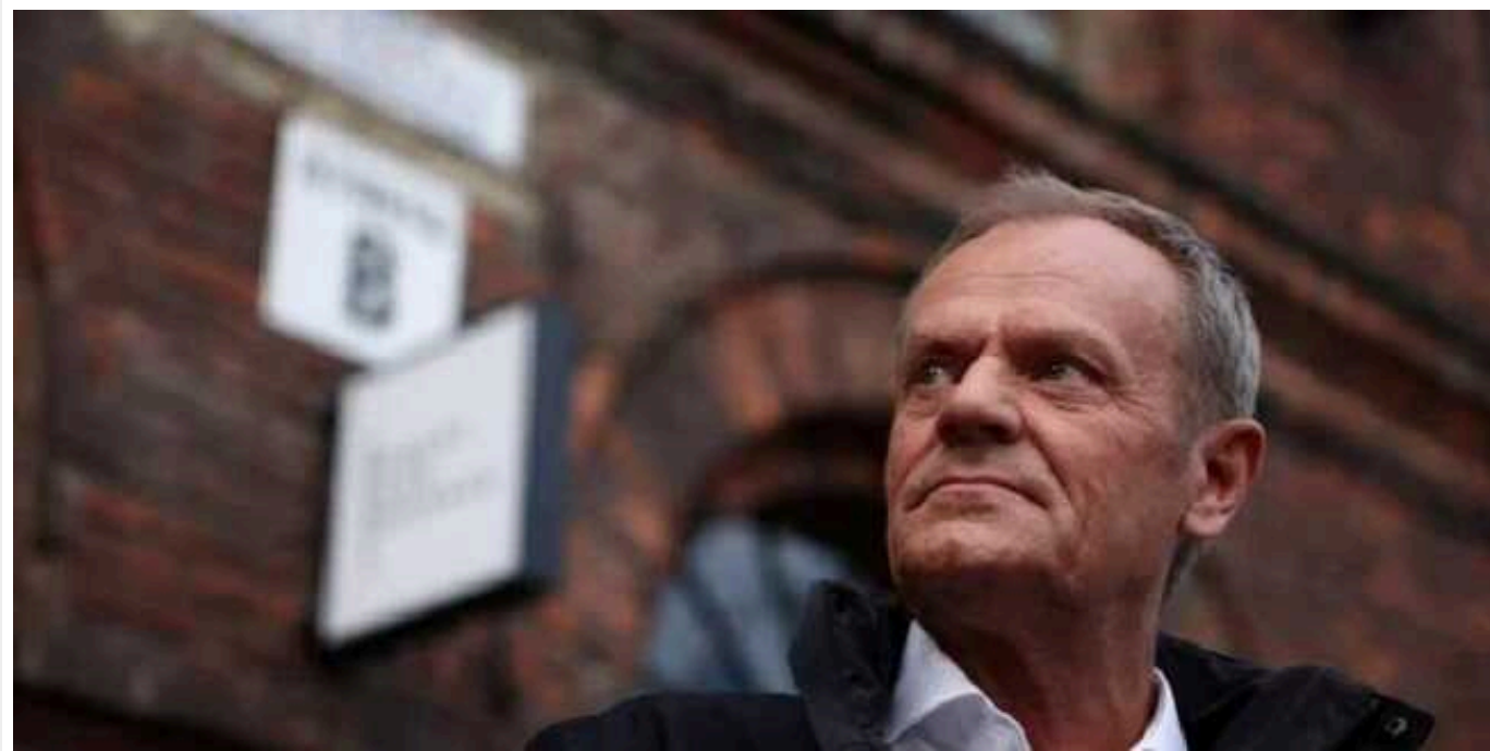
Туск пообіцяв "ніколи в житті не дозволити" антиукраїнські настрої у своєму уряді

Прем'єр-міністр Польщі Дональд Туск заявив, що не допустить антиукраїнських настроїв у своєму уряді. За його словами, ситуація в Україні та, зокрема, на фронті є питанням номер один для польської безпеки.