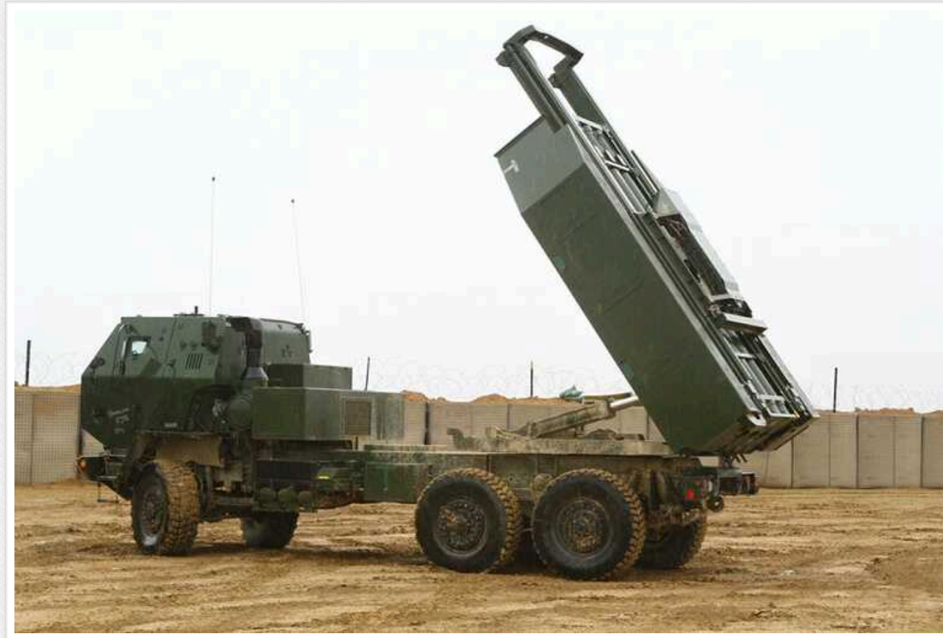
Залужний показав роботу РСЗВ HIMARS: ефективно нищить техніку і живу силу противника

Українські захисники ефективно знищують військову техніку ворога та ліквідовують окупантів за допомогою реактивної артилерійської системи HIMARS. Американську РСЗВ наші воїни використовують по всій лінії фронту.