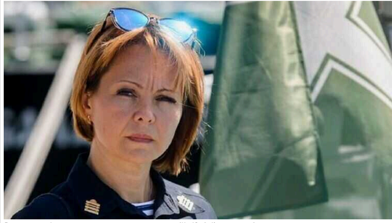
Гуменюк розповіла, чому окупанти не змогли використати "Калібри" під час ранкової атаки

Російські окупанти під час ранкової атаки не використовували крилатих ракет "Калібр" морського базування. Причиною цього став шторм на морі.