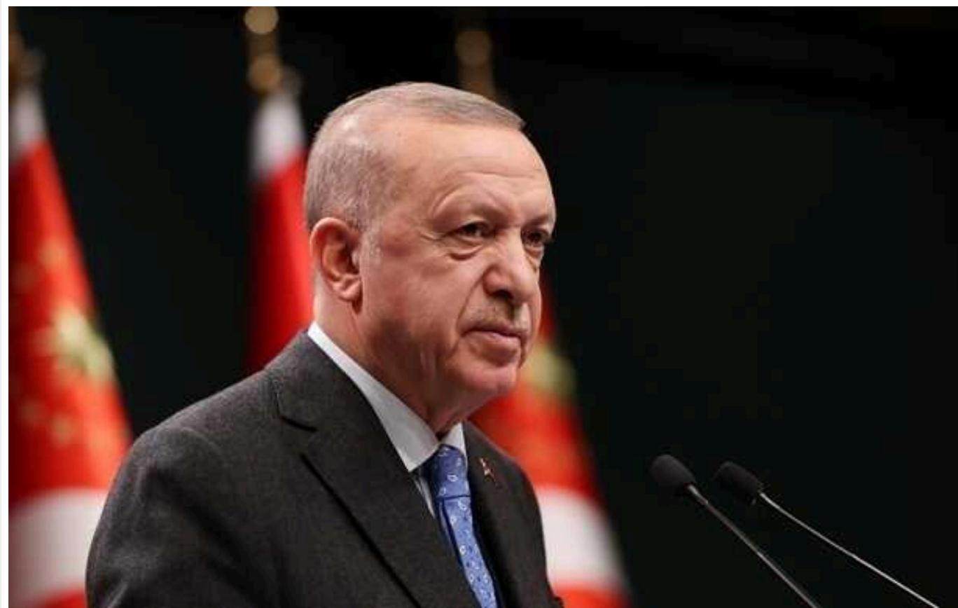
Президент Туреччини терміново збирає у Стамбулі нараду з питань безпеки

Сьогодні в Стамбулі відбудеться нарада з питань безпеки за головування президента Туреччини. Участь у нараді візьмуть керівники силового блоку країни, очільники МЗС та розвідки.