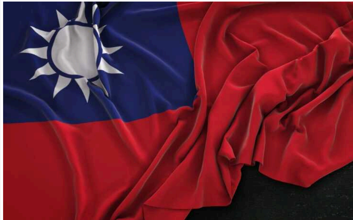
На Тайвані розпочалися парламентські та президентські вибори

У суботу, 13 січня, на Тайвані відкрилися дільниці для проведення президентських та парламентських виборів.