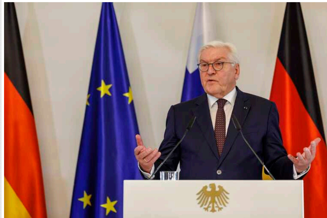
У Німеччині президент розкритикував уряд за погану комунікацію із населенням

Президент Німеччини Франк-Вальтер Штайнмаєр вважає, що неналежна комунікація рішень федерального уряду спричинилась до падіння рейтингів коаліційних партій, зокрема його рідної Соціал-демократичної.