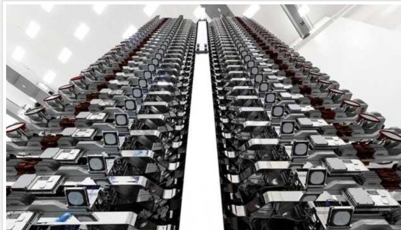
Компанія Маска SpaceX вчетверте за п'ять днів перенесла запуск нової партії Starlink

Компанія SpaceX у суботу, 13 січня, вже четвертий раз за останні 5 днів перенесла запуск наступної партії 22 інтернет-спутників Starlink.