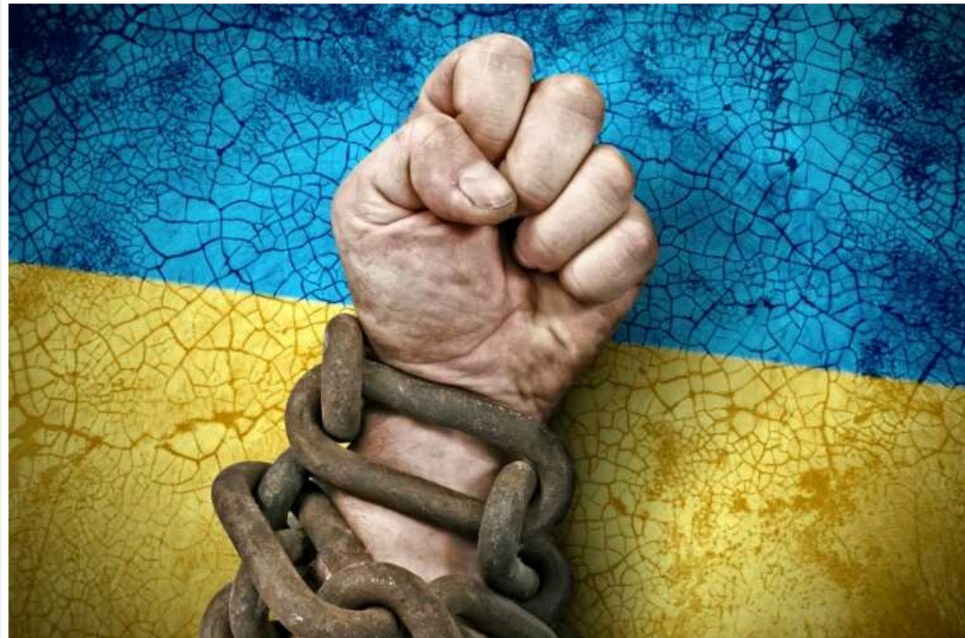
Окупанти утримують понад 100 цивільних українців, яким не винесли обвинувачень – правозахисниця

Росія утримує понад 100 цивільних українців без винесення обвинувачення. Серед них є жителі тимчасово окупованих територій Херсонської та Запорізької областей.