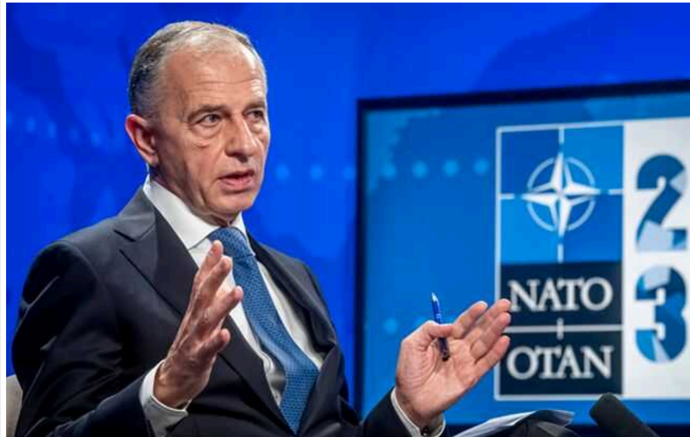
Заступник генсека НАТО скептично оцінює наміри Трампа вивести США з Альянсу

Заступник генерального секретаря Північноатлантичного Альянсу Мірча Джоане у відповідь на питання, чи становить небезпеку для НАТО експрезидент США Дональд Трамп, заявив, що Америка зараз як ніколи потребує союзників.