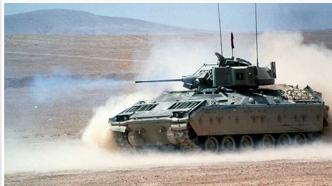
Біля Авдіївки БМП "Bradley" здолала у ближньому бою російський танк Т-90М

Американська БМП "Bradley" змогла вивести з ладу новітній танк окупантів Т-90М на Авдіївському напрямку. Український екіпаж БМП майстерно обстріляв танк, який втратив керування і врізався у дерево.