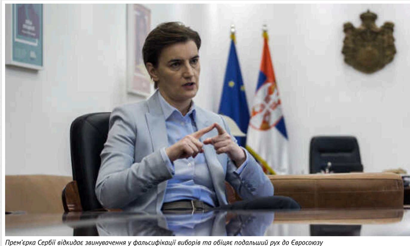
Прем'єрка Сербії відкидає звинувачення у фальсифікації виборів та обіцяє подальший рух до Євросоюзу

Прем'єр-міністерка Сербії Ана Брнабіч відкинула звинувачення опозиції у фальсифікації на парламентських і місцевих виборах минулого місяця, запевнивши, що прийдешній уряд продовжить роботу над інтеграцією в ЄС.