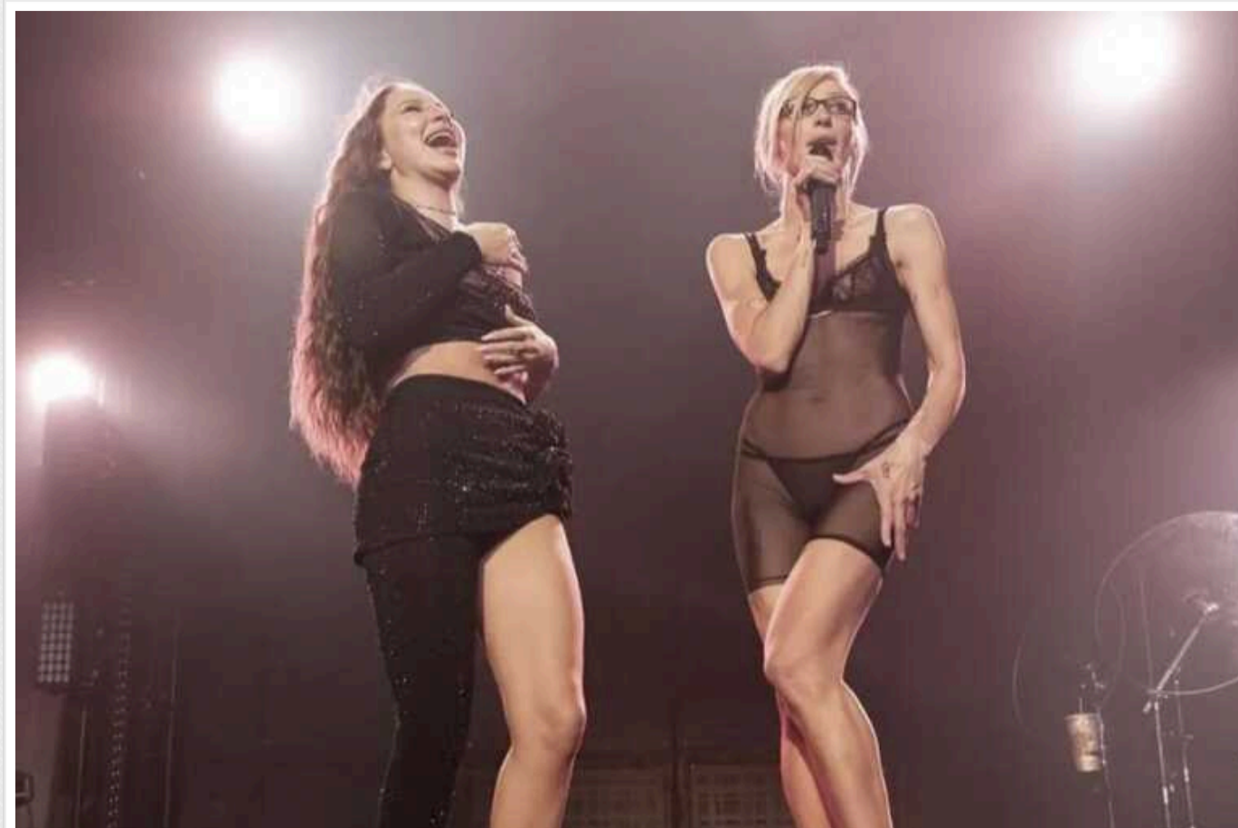
Стало відомо, як зрадниця Анна Asti відкупилася в Кремля через "голу вечірку"

Українська співачка родом з Черкас Анна Asti (Asti) могла піти на угоду з Кремлем, аби реабілітувати репутацію після участі у скандальній "голій вечірці" ведучої Насті Івлєєвої. Для цього артистці-зрадниці начебто довелося в дечому поступитися.