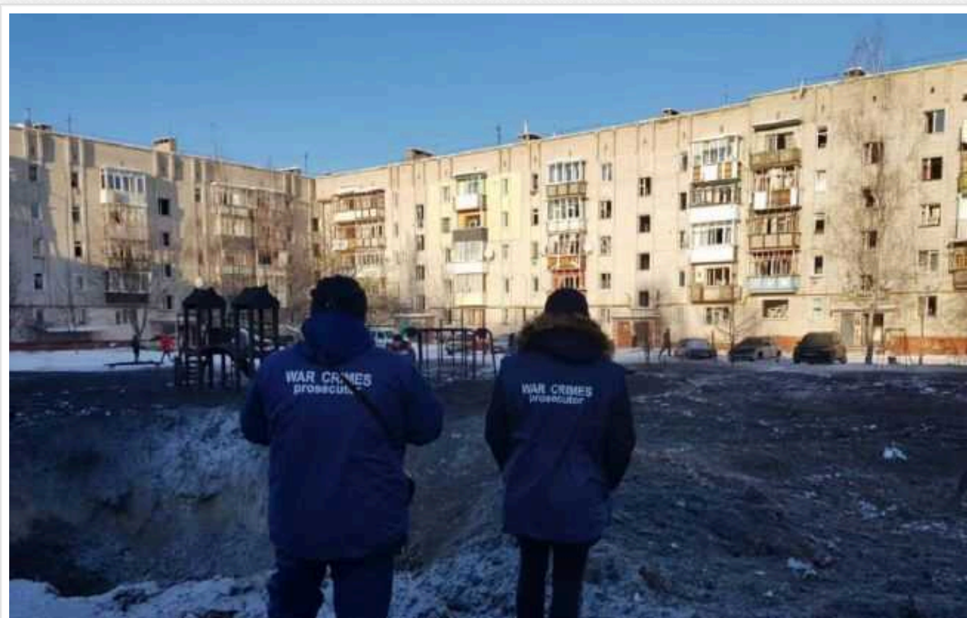
Окупанти вдарили по місту у Сумській області: є постраждалий

Російські окупанти обстріляли місто Шостка у Сумській області зранку 13 січня. Є поранений.