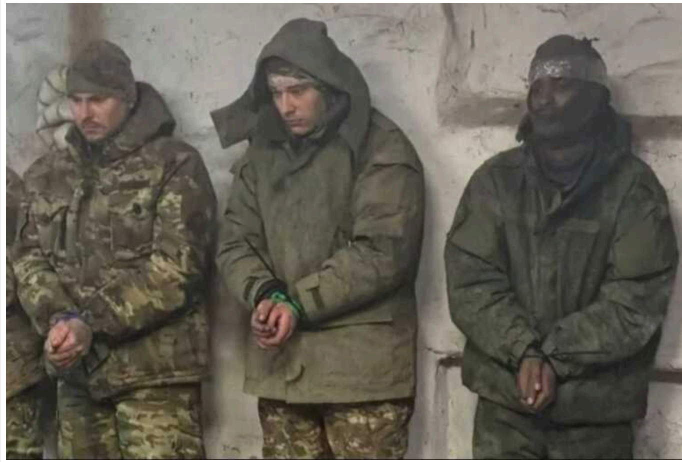
У ЗС РФ з'явилися найманці із Сомалі

Країна-терористка РФ продовжує вербувати найманців по всьому світі для поповнення військового угруповання в Україні. Збройні сили України вперше взяли у полон громадянина Сомалі, який воював у складі російської армії, повідомляє офіційний телеканал Міноборони України.