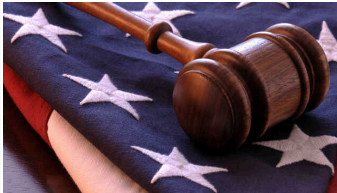
Суд США зобов'язав Трампа виплатити The New York Times 400 тисяч доларів

Суддя Верховного суду Нью-Йорка Роберт Рід зобов'язав експрезидента США Дональда Трампа виплатити The New York Times майже 400 тис. доларів за судові витрати після програного позову проти газети.