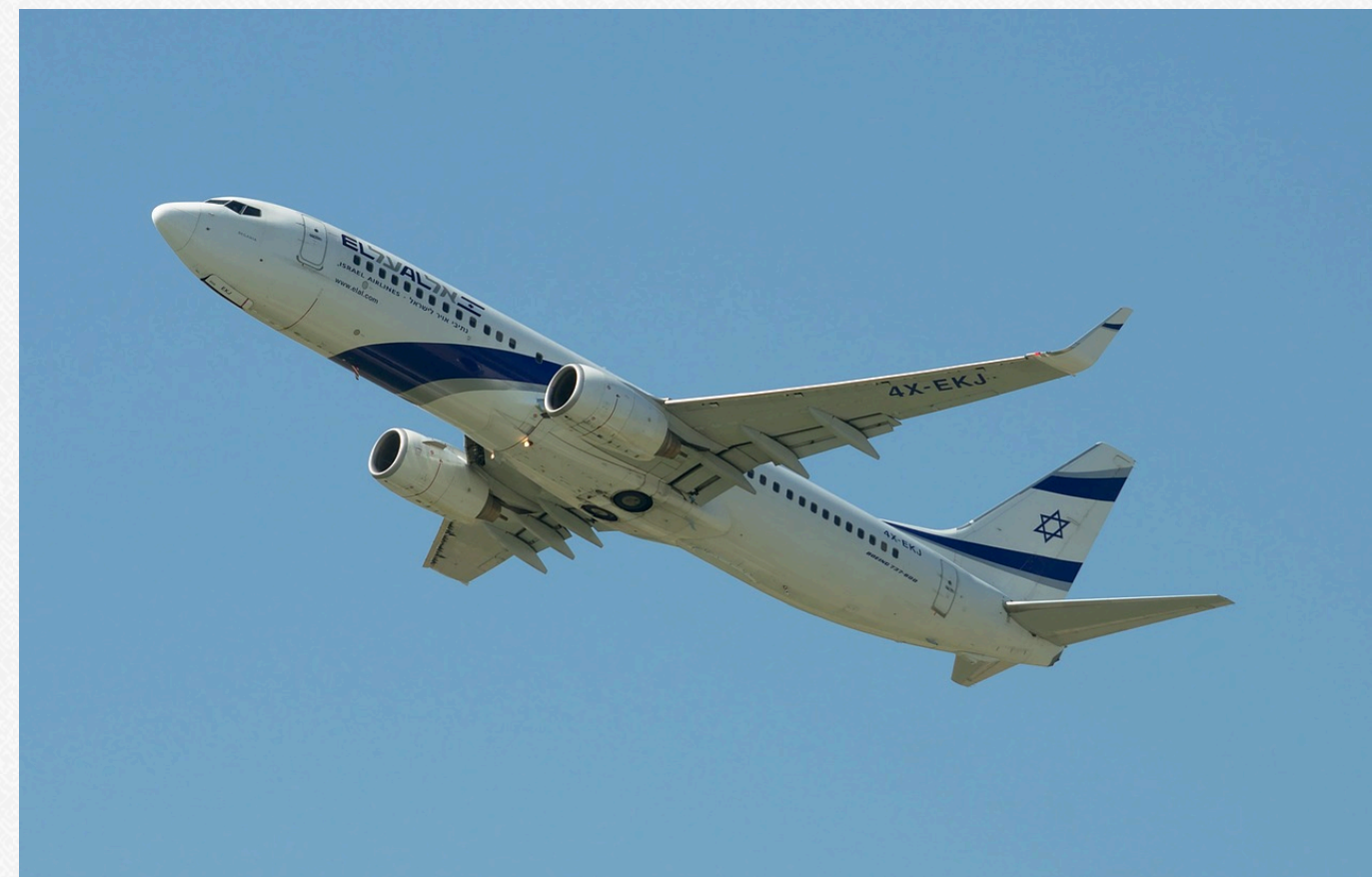
Фото: Літак ізраїльської авіакомпанії El Al

В цей час обмежену кількість рейсів виконували ізраїльські авіакомпанії El Al, Israir і Arkia. Також деякі іноземні авіакомпанії продовжували свої рейси до Ізраїлю протягом усього конфлікту – Flydubai, Ethiopian Airlines і Etihad Airways.