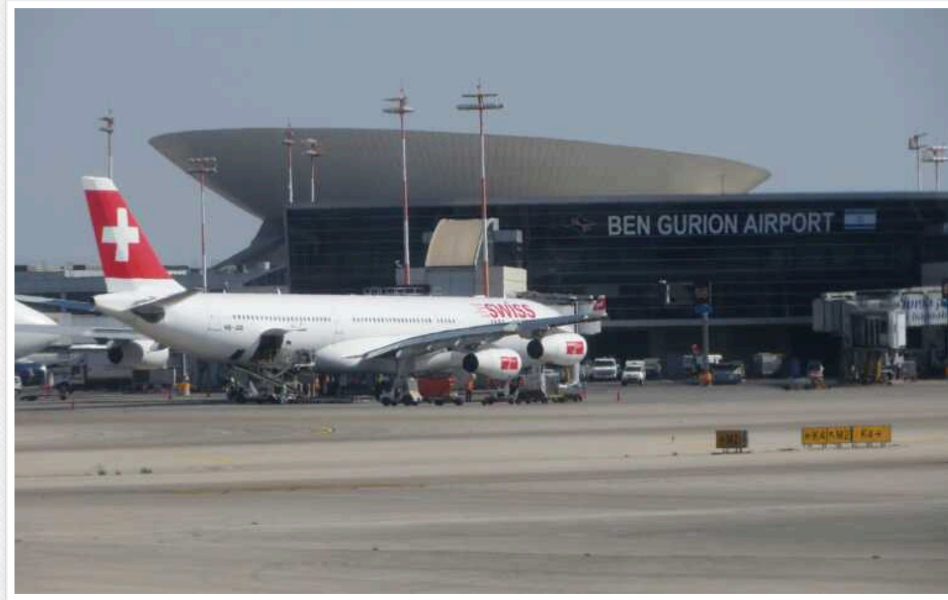
Європейські авіакомпанії відновлюють рейси до Ізраїлю

Вісім європейських авіакомпаній готуються частково відновити рейси до Ізраїлю у найближчій місяць. Робота маршрутів залежатиме від ситуації з безпекою.