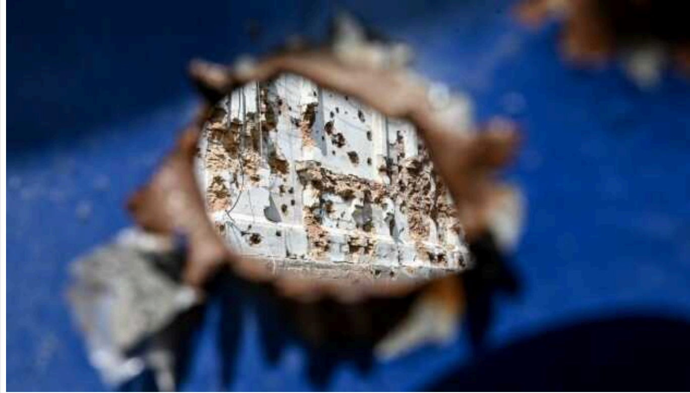
Російські загарбники минулої доби завдали 129 ударів по Запорізькій області

Упродовж минулої доби російські війська завдали 129 ударів по 19 населених пунктах Запорізької області.