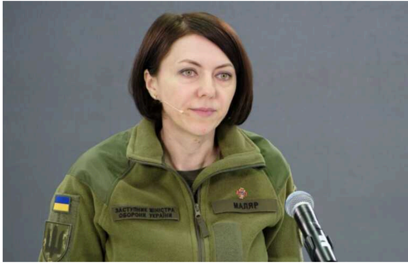
Мета окупантів зараз - не масштабний наступ, а виснаження ЗСУ, - Маляр

"Їхня мета зараз - максимально нас виснажити. Щоб ми не могли створити запаси боєприпасів, не могли підготувати техніку і морально зламалися. Вони діють так, щоб ми не встигали відновлюватись", - написала вона в Telegram.